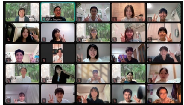
キックオフ・ミーティングの様子

このあとは、8月4日（月）～6日（水）に実施する全国合宿が大きなイベントとなります。活動開始から1か月後というタイミングでの合宿により、インターン生同士の交流を早期に深め、情報交換やミニプロジェクトの活性化が期待されます。