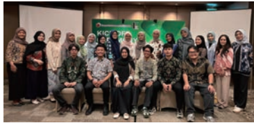
NGOラーニング第7期キックオフの様子

SOMPO環境財団がインドネシアで実施している海外版CSOラーニング制度「NGO Learning Internship Program」では、現在第7期生25名がジャカルタ近郊の環境NGO11団体で活動しています。インドネシアにおけるインターン活動の特徴は、環境分野に直接関わる事業にとどまらず、デザインや会計といった分野でも、それぞれの学生が専門性を活かして活躍している点です。あるインターン生は、「派遣先団体では例え小さな貢献であっても、丁寧なアドバイスと建設的なフィードバック、そして感謝の言葉をもらうことができ、それを励みとして自分自身の成長を実感しています」と、活動の中での手応えを語ってくれました。