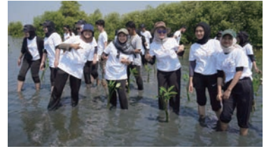
植林イベントの様子

期を越えた修了生の交流は、インドネシアでは初めての試みとなりました。今後も財団では、SIIとの連携を通じて、こうしたつながりを広げていけるよう、取組みを継続して参ります。