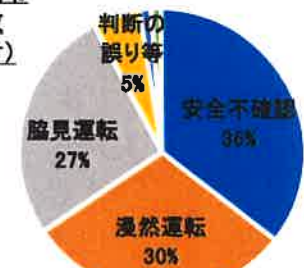
原付以上運転者の法令違反別死亡事故件数 (第二当事者: 歩行者)

歩行者の急な道路横断や飛び出しなどによる交通死亡事故を防ぐため、ドライバーは常に運転に集中し、歩行者の動きに十分注意を払い、歩行者の保護に努めなければなりません。